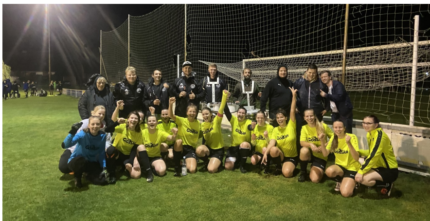
Punktgewinn gegen die Frauen von Hillerse. Mannschaft mit Fans.