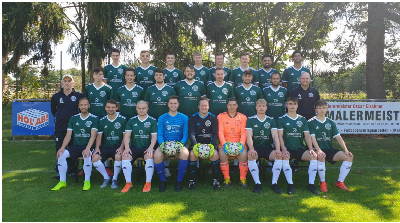
Die Mannschaft der 1. Herren