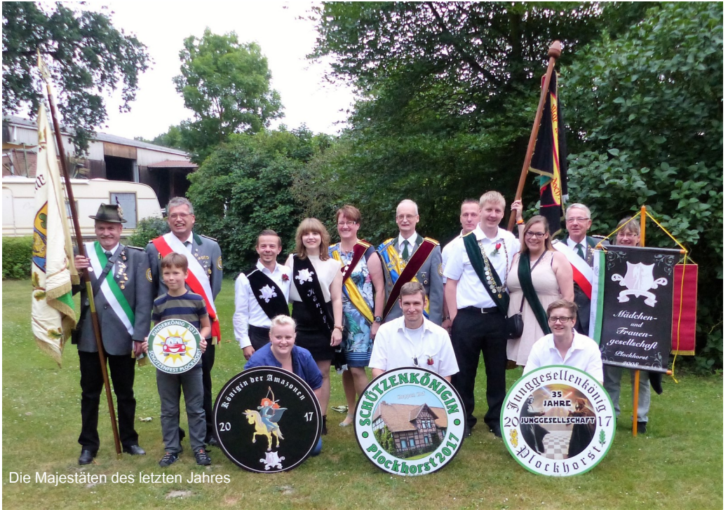
Die Majestäten des letzten Jahres

ßen der verschiedenen Jugendscheiben und des Winzerkönigs statt. Das Ausschießen des Kinderkönigs, an dem Kinder bis 9 Jahre teilnehmen können, wird erstmalig mit einem Lichtpunktgewehr ausgeschossen. Hier freut sich das Orga-Team auf viele neugierige, junge Teilnehmer.